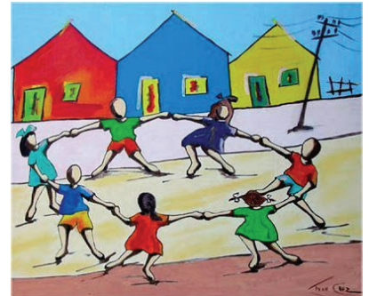
Ciranda II, 2018. Ivan Cruz.