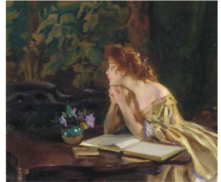
Momentos de ócio, 1901. Irving Ramsey Wiles.